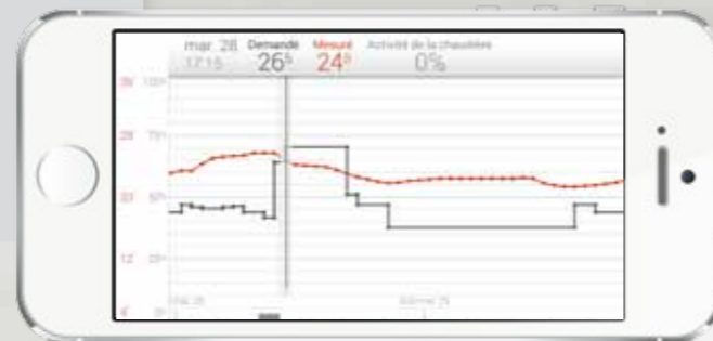
Affichage des consommations