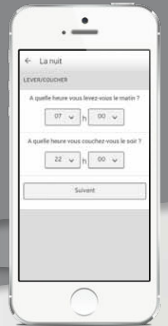
Réglage de la programmation