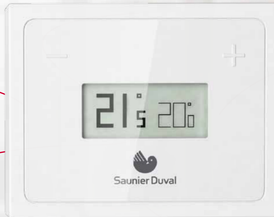
Boîtier d'ambiance. Taille réelle