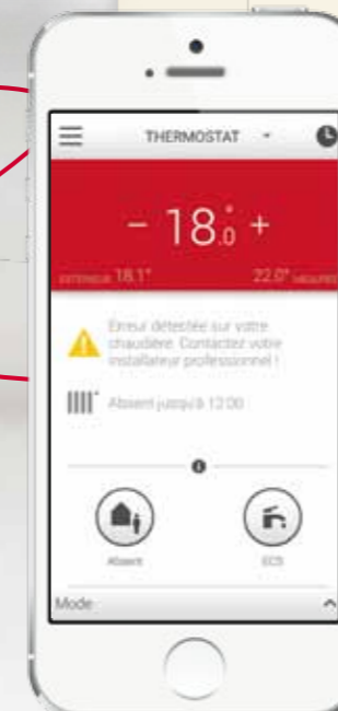
Rappel des besoins de maintenance