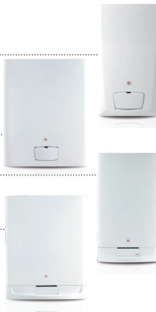
Tableau 5 : ..... Isomax Condens F 35 E

Tableau 4 : ..... Isosplit Condens F 30 E Isosplit Condens F 35 E