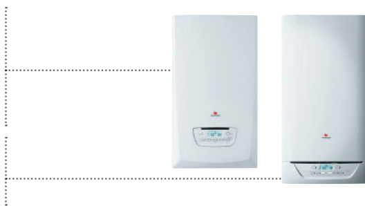
Tableau 7 : ..... Duotwin Condens F 30

Tableau 6 : ..... Thema Condens F 25 Thema Condens F 30 Thema Condens F AS 12 Thema Condens F AS 25 ThemaPlus Condens F 25 ThemaPlus Condens F 30 ThemaPlus Condens F 35 Isofast 21 Condens F 25 Isotwin Condens F 25 Isomax Condens F 30 Isomax Condens F 35